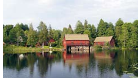
Die Natur Smålands hat viel zu bieten. Das wollen Otto und Gaby Seitz ihren Landsleuten in Deutschland gern vermitteln.