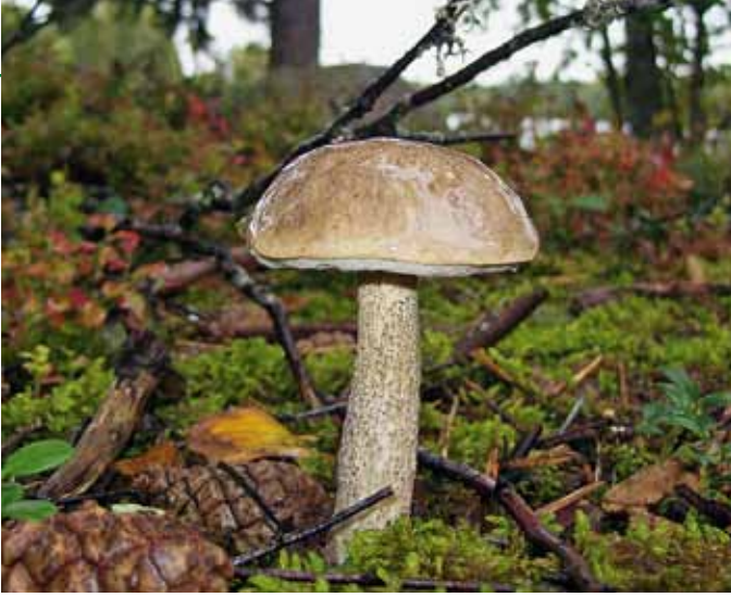
Standen im September einfach überall : schmackhafte Pilze