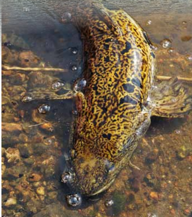
An den Nebenseen des Vrigstadsån gibt es eine Quappen-Garantie

Slattsjön, Lundholmsjön, Pelikroken und viele mehr – zwischen Vrigstad und Gisabo reihen sich kleinere Seen wie auf einer Perlenkette aneinander. Und alle sind durch den Fluss oder Kanäle verbunden. Durchschnittlich sind die Seen zwei bis drei Meter tief mit Löchern, die bis in sieben Meter Tiefe abfallen. Und genau dort sammeln sich im Herbst die Räuber. Während wir vor Ort waren konnten wir wegen eines Hochwassers nur zwei der hübschen, fischreichen Gewässer beangeln – doch das lohnte sich richtig: Beim Abfahren der Seerosenfelder zogen wir den Anker nicht einmal als Schneider. Und in den Löchern erlebten wir so einige Phasen mit mehr als 50 Bar-