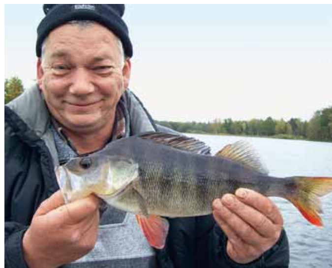
Einer von vielen: Barsche standen an den tiefen Stellen der Seen gestapelt