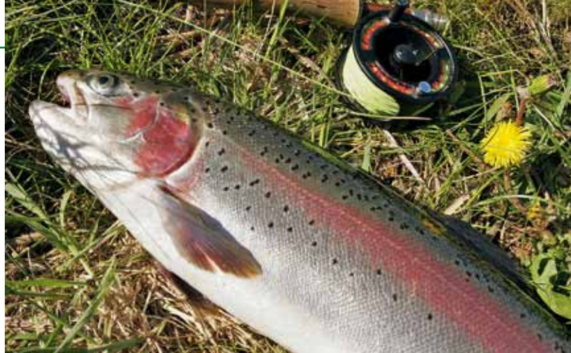
Für Forellen-Fans: Am schönen Kalvsjön warten dicke Regenbogner

milie an einem völlig naturbelassenen See den Regenbognern auf die Schuppen rücken. Die Saison beginnt am 15. Mai und endet am 30. September. Angeln dürfen Sie nur mit künstlichen Ködern. Der See ist rundum befahrbar, Steganlagen laden zum Angeln ein, die Karte (rund 16 Euro am Tag, maximal drei Fische je Angler) und Infos zur Tiefenstruktur bekommen Sie an der Infohütte gleich am Camping-