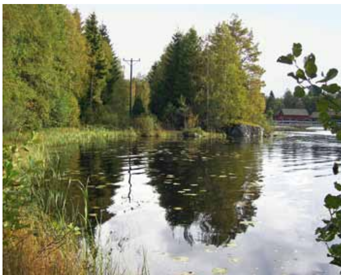
Laden zum Anker ein: die Seerosenbuchten des Flusses