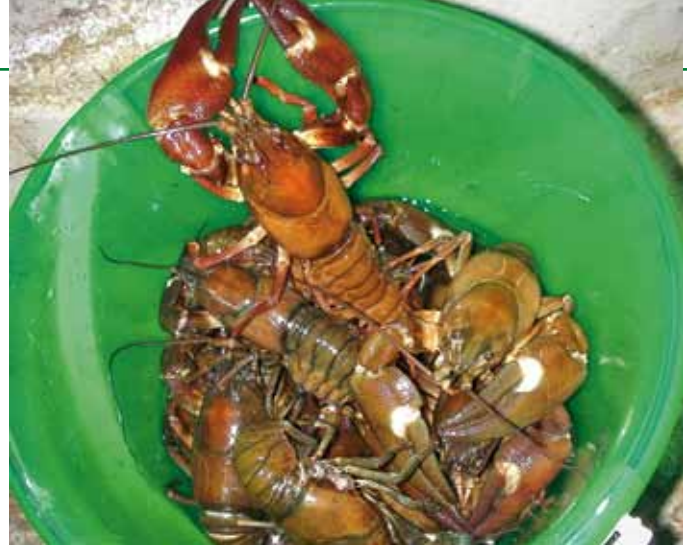
Und als Beilage kamen Signalkrebse in den Topf

Regenperioden sind Pferde- stärken am Heck auch zu empfehlen, um die oft engen Verbindungskanäle zwischen den einzelnen Seen bei ablaufendem Wasser zu passieren. Zwei PS reichen aber völlig aus.