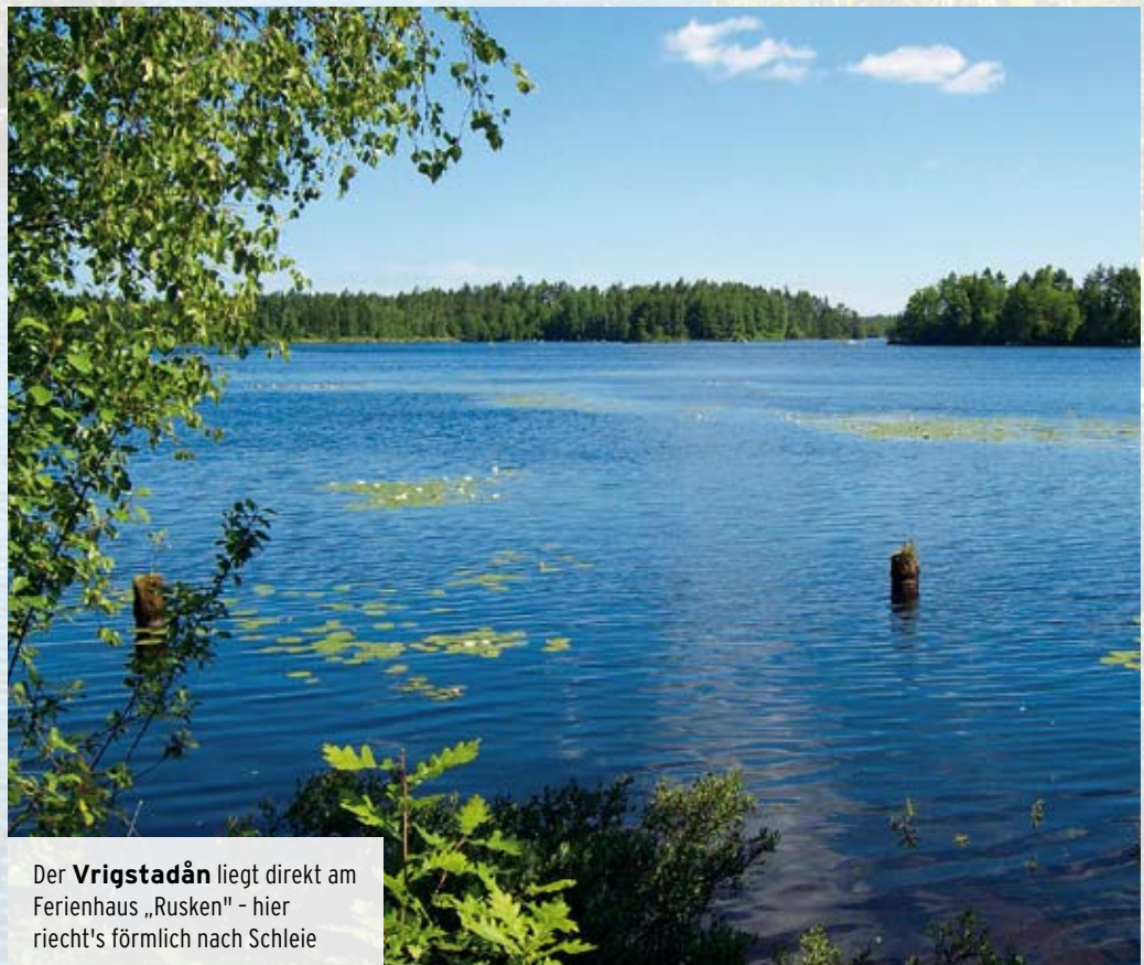
Der Vrigstadån liegt direkt am Ferienhaus „Rusken“ - hier riecht's förmlich nach Schleie

01805-11 66 88 14 Ct/Min. i. dt. DTAG-Festnetz, Mobilpreise ggf. abweichend