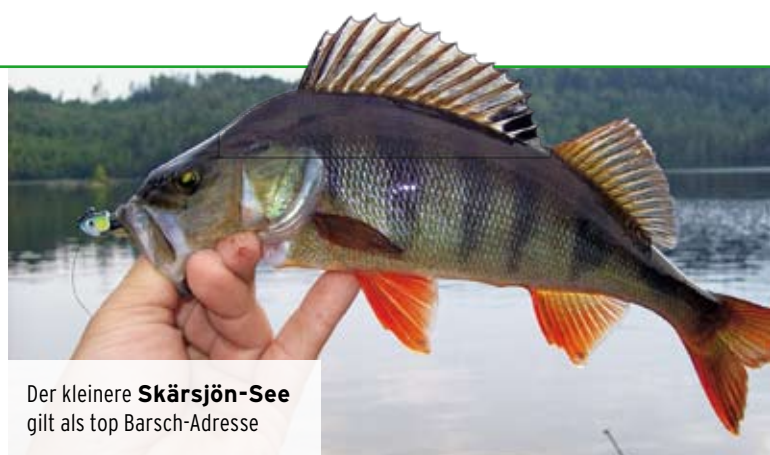
Der kleinere Skärsjön-See gilt als top Barsch-Adresse

Der Räuber-Reigen im Rusken wird von Barschen bis 50 Zentimeter abgerundet. Der Bestand ist aber nicht ganz mit denen von Zander und Hecht vergleichbar. Kurz vor meiner Ankunft wurden zwei Exemplare von jeweils 48 Zentimetern gefangen. Meine Barschausbeute war nicht ganz so pri-