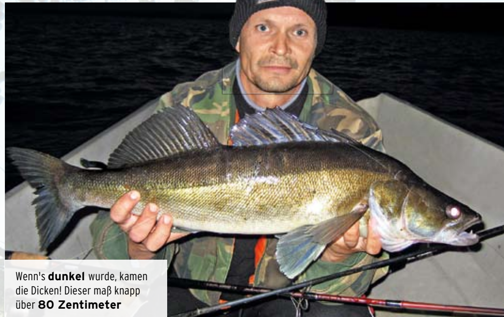
Wenn's dunkel wurde, kamen die Dicken! Dieser maß knapp über 80 Zentimeter

wahrscheinlich der Mund weit offen. „Der Hecht-Bestand ist ebenfalls gut, doch der Zander hat ihm die Spitzenposition abgenommen. Wegen des immer noch guten Hechtvorkommens sind Stahlvorfächer Pflicht – die Zander stören sich im Übrigen nicht daran“. Otto fügte an: „Das Ganze wird durch Barsche, Große und Kleine Maränen, Aalquappen und Weißfische komplettiert“. Nach diesen Sätzen stand ich restlos in Flammen und der Abend diente ausschließlich der Sondierung meines Gummiködertimentes. Ich wollte es nur mit Kunstködern versuchen, obwohl mir See-Experten aus Österreich bei der Ankunft zum Köder