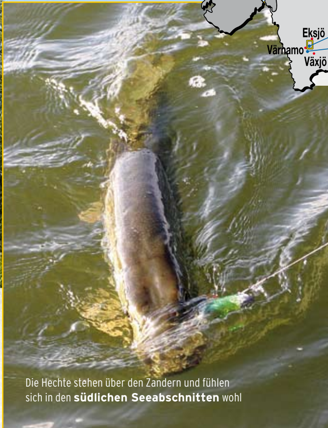
Die Hechte stehen über den Zandern und fühlen sich in den südlichen Seeabschnitten wohl

Wir entführen Sie in diesem Småland-Spezial an den Rusken, den Flären und einige kleinere Schleisen bei Eksjö